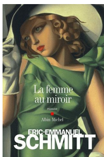
Eric-Emmanuel Schmitt : La femme au miroir