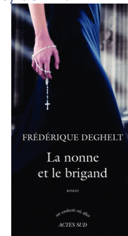
Fred Deguelst : La nonne et le Brigand